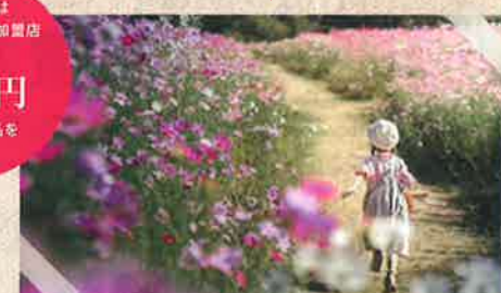
第12回豊浦フォトコンテスト入賞作品「コスモスの道を駆ける」

詳しくは豊浦Webフォトコンテストのホームページへ！ 豊浦フォトコン 検索 http://www.toyoura-q.com/contest/ お問合せ先：豊浦町観光協会 TEL:083-774-1211