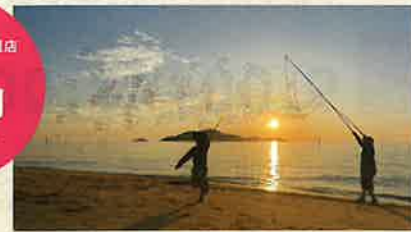
第14回豊浦フォトコンテスト会長賞作品「梅雨時間」

詳しくは豊浦Webフォトコンテストのホームページへ! 豊浦フォトコン 検索 http://www.toyoura-q.com/contest/ お問合せ先：豊浦町観光協会 TEL:083-774-1211